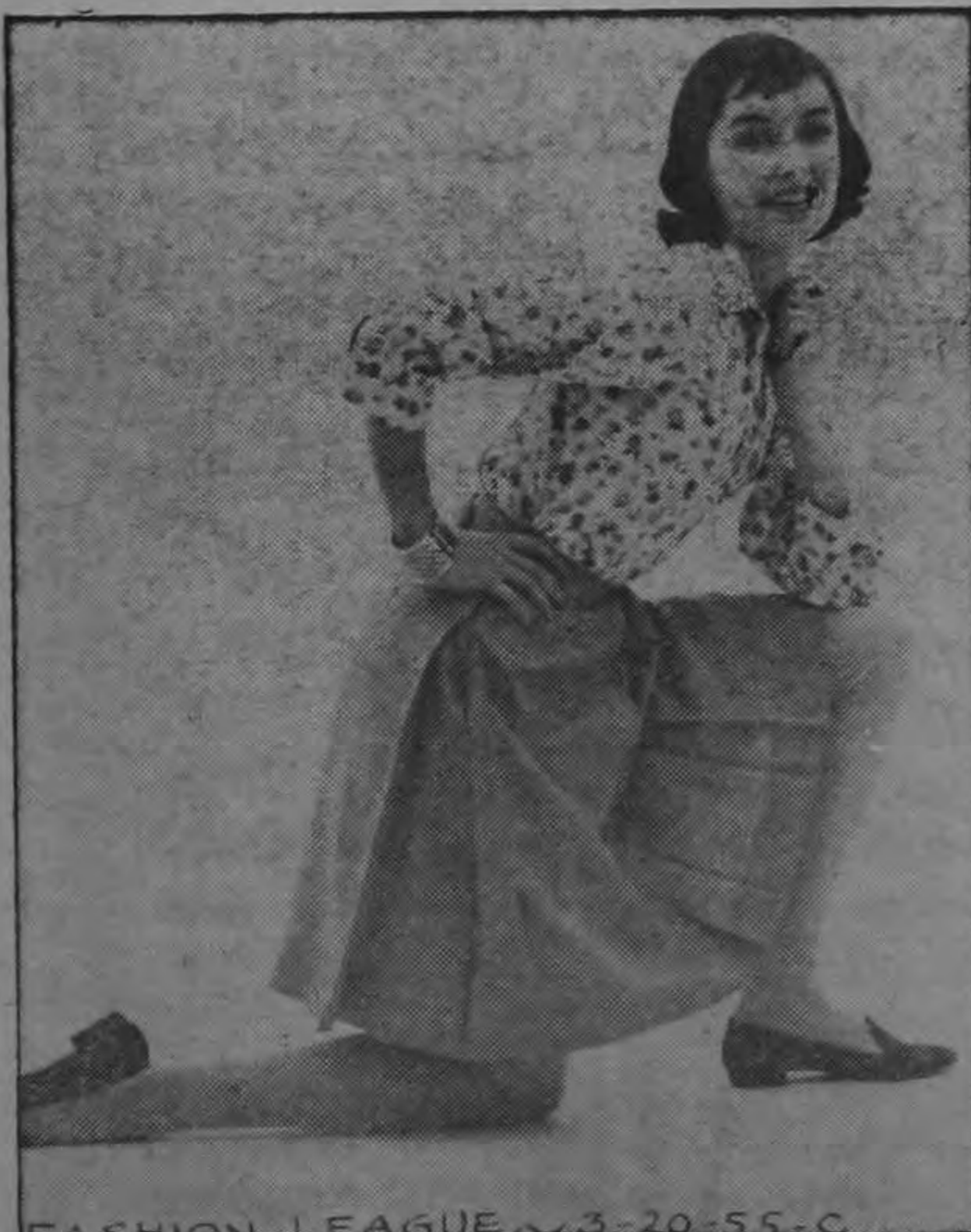
FASHION LEAGUE 3-20-55-C

Para usar con trajes sencillos de campo, se aconsejan medias de colores claros.