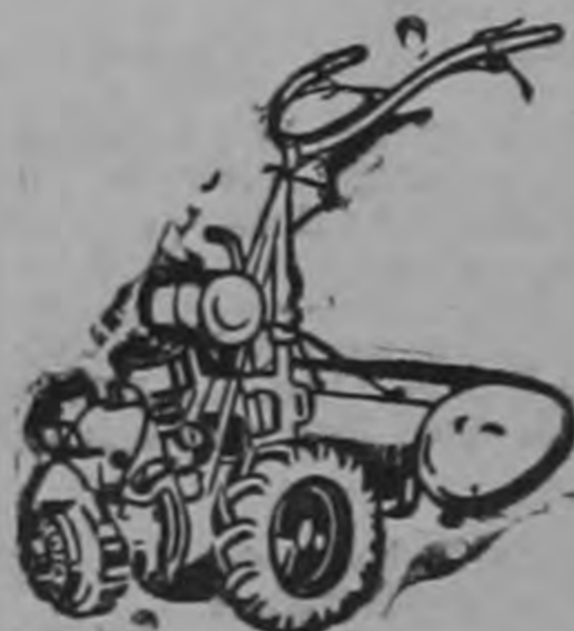
Antonio Lines & Cia. Ltda. Frente a Singer. Teléfono 4963.

HOJA SIERRA CINTA PARA aserradero de 4, 5 y 6" acero nicromo. Precio especial Rudin & Jiménez. 50 varas Oeste Botica Dolorosa.