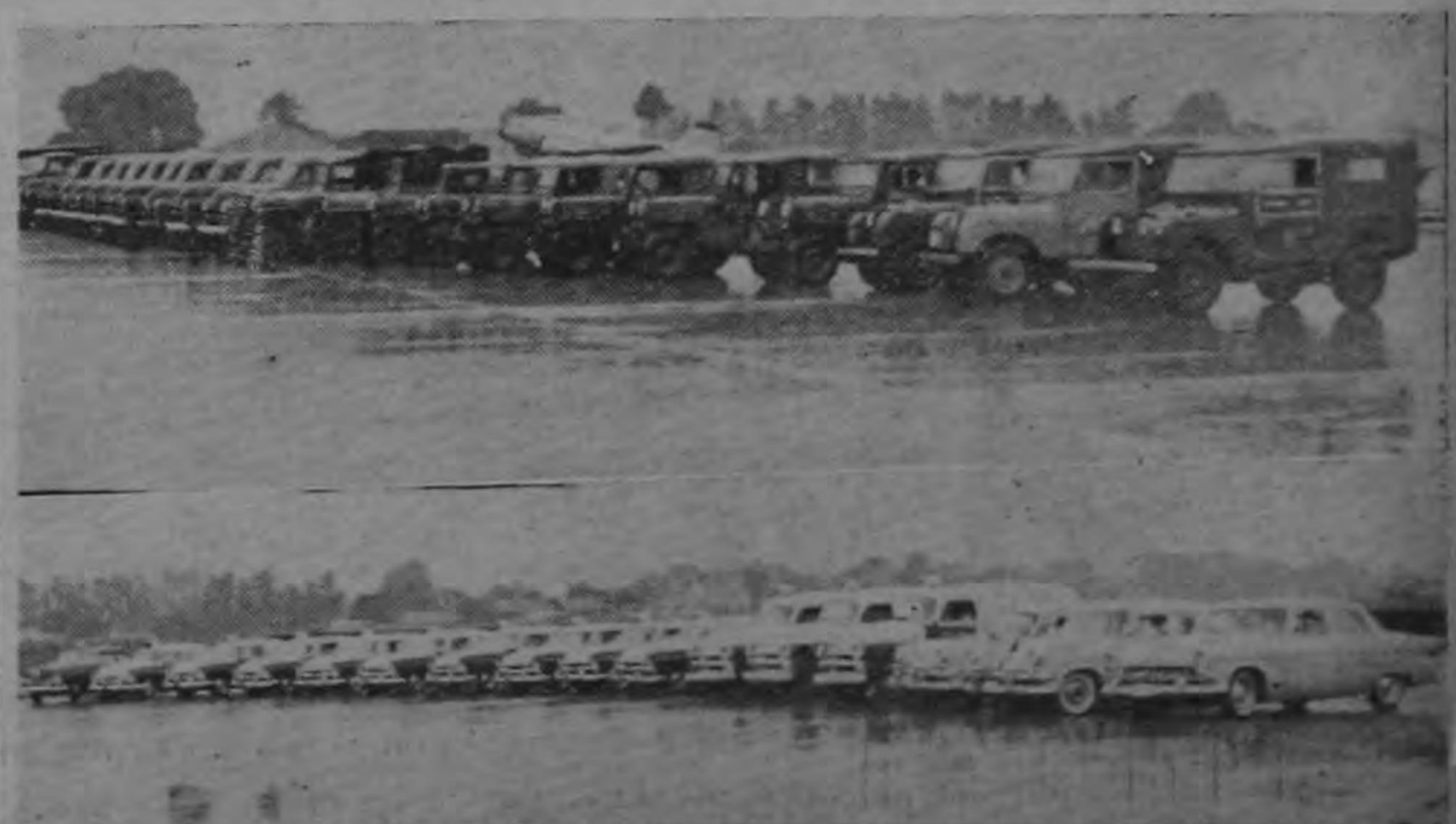
RADIO PATRULLAS Y VEHICULOS DE LA FUERZA PUBLICA.— Estas magníficas gráficas muestran la cantidad de vehículos de la Fuerza Pública que son utilizados en la labor de vigilancia y patrullaje. Véaseles a todos en buenas condiciones.